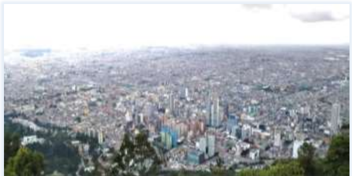
ころんぴあ しゅと ほごた ぜんけい コロンビアの首都、ボゴタの全景 かんこうち もんせらーて おか (観光地のモンセラテの丘より)