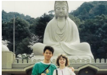
一緒に京都を散策したイギリスのALTと☺