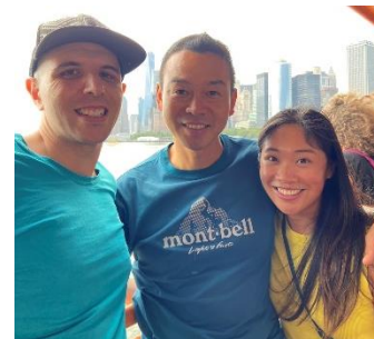
アメリカ旅行中に、ニューヨークの友達と。